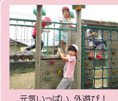
元気いっぱい、外遊び！