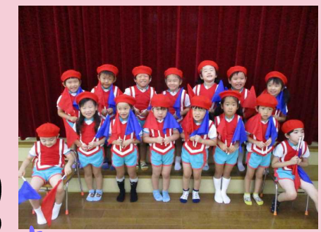
運動会、頑張るぞー♪