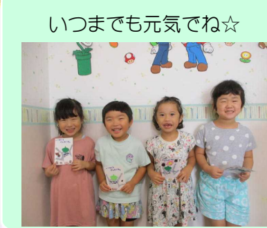
いつまでも元気でね☆