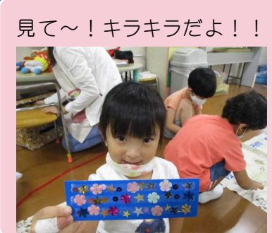
見て～！キラキラだよ！！