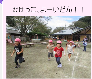
かけっこ、よーいどん！！