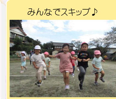
みんなでスキップ♪