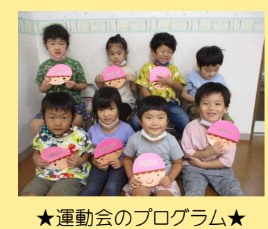
★運動会のプログラム★