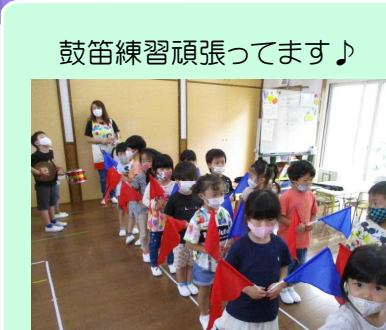
鼓笛練習頑張ってます♪