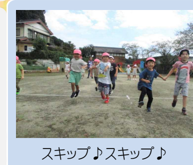
スキップ♪スキップ♪