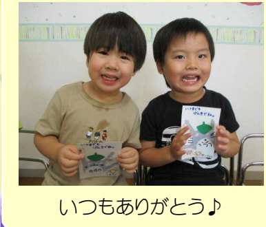
いつもありがとう♪